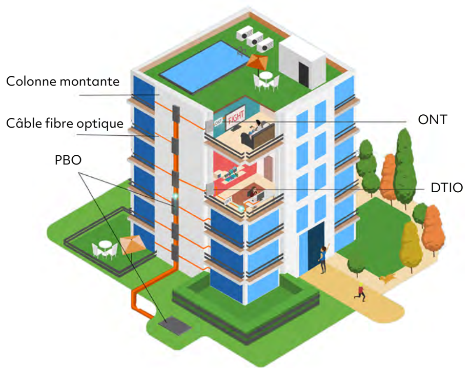
ONT : Optical Network Terminal DTIO : Dispositif de Terminaison Intérieure Optique

Les câbles seront déployés de préférence dans les parties communes pour en faciliter l'accès. Ils seront acheminés par une colonne montante à tous les étages grâce à des goulottes ou des gaines techniques. Des Points de Branchement Optique seront ensuite installés sur les paliers en fonction de la configuration de votre immeuble. La fibre optique passera ainsi des PBO jusqu'à l'intérieur de votre logement.